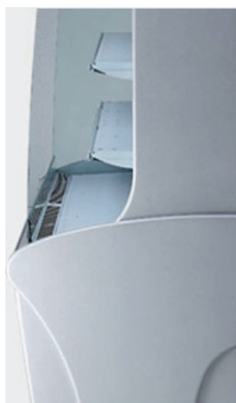
Vu de côté