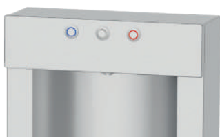
3 boutons électriques pour la distribution d'eau 3 electric buttons for water distribution