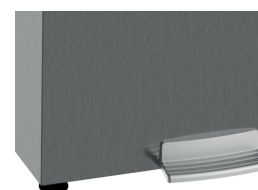
Pédale en option Water distribution by pedal in option