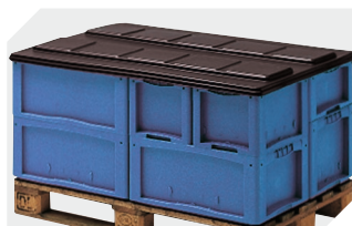
Coiffes pour conteneurs palettisés l 1220 x l 820 mm 9-18421