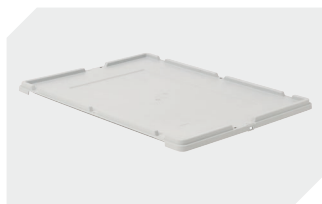
Couvercle coiffant pour bacs gerbables norme Europe, série XL l 800 x l 600 mm 43-14853