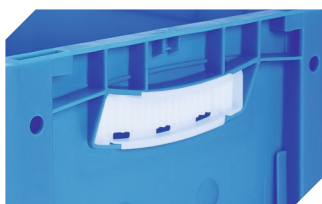
Obturbateurs pour poignées ouvertes pour bacs gerbables norme Europe, série XL d'une hauteur de 170, 220 et 270 mm 43-31450