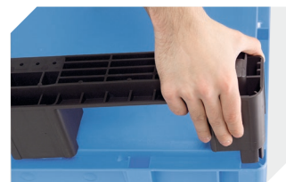
Kit de semelles pour bacs gerbables norme Europe, série XL 43-20273