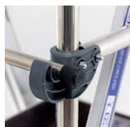
Blocage très fiable du portillon