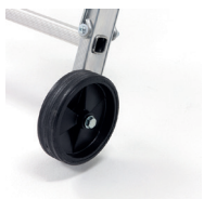
2 roulettes Ø 160 mm pour les déplacements