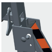
Verrous arrière anti-soulèvement