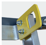
Anneaux de grutage