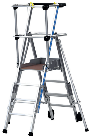
Modèle 3 à 4 marches

Cette PIR-PIRL en aluminium est la référence des plates-formes télescopiques. Disponible en plusieurs modèles jusqu'à 4m46 de hauteur travail ; 3-4 / 5-7 / 8-10 / 8-11 marches. Ses montants renforcés, sa plate-forme large, ses stabilisateurs réglables, son garde-corps rigide semi-automatique, font du Sherpascopic un produit extrêmement robuste et stable. Il dispose d'un porte-outils, de roues de déplacement de 160mm de diamètre et de marches de 80 mm. Il répond aux normes PIR - PIRL et EN 131-7, au décret 2004-924 et est labellisé NF. Le produit fermé fait 38 cm et dispose de sangles de blocage pour le transport.