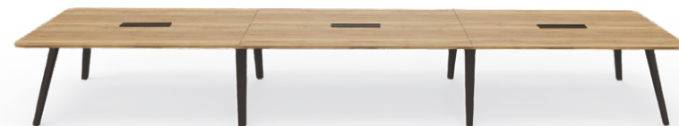
Table 16 à 22 places L.575 cm 3 plateaux + 8 pieds