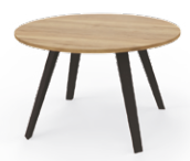
Table ronde Ø 120 cm