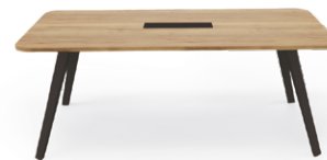
Table 6 à 10 places L.195 cm 1 plateau + 4 pieds