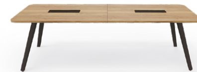
Table 8 à 12 places L.255 cm 2 plateaux + 4 pieds