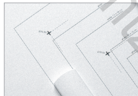
Tracés des formats courants sur la table

Cisaille adaptée au format A3 et conçue pour de petits travaux de façonnage.