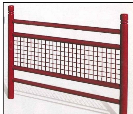
Réf : 206800B