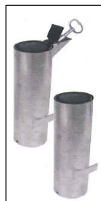
Réf : 203404