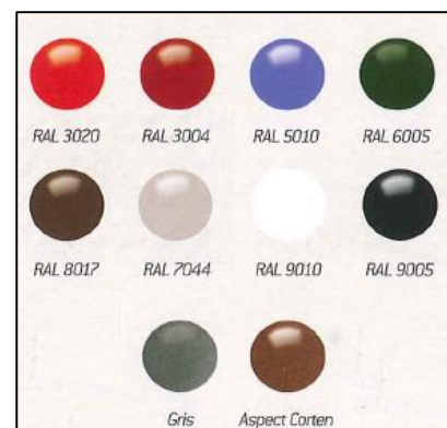
Réf : RAL/90660