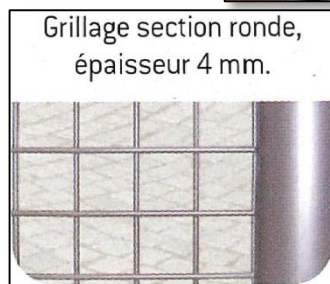
Grillage section ronde, épaisseur 4 mm.