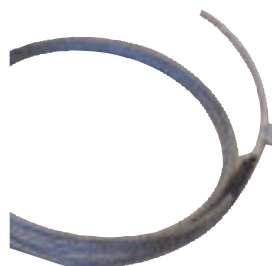
Cordon chauffant sur mesure Type CU