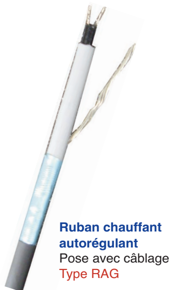
Ruban chauffant autorégulant Pose avec câblage Type RAG