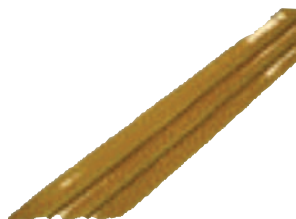
Ruban chauffant industriel (150W/m) Type BK