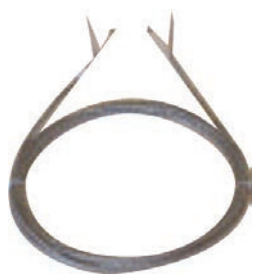
Porte chambre froide vitrine réfrigérée Type IC