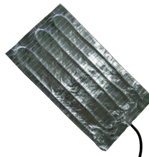
Surfaces chauffantes aluminium adhésives