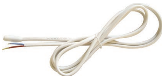
Ecoulement de condensats Type BS