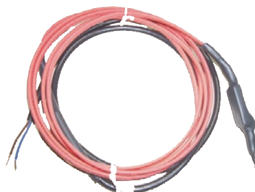
Hors-gel pour pompe à chaleur CB hors-gel thermostat +5°C