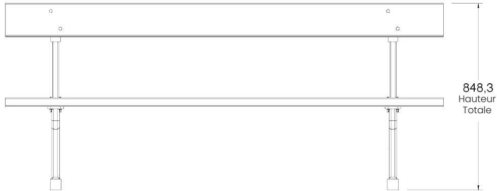
▶ Vue de face