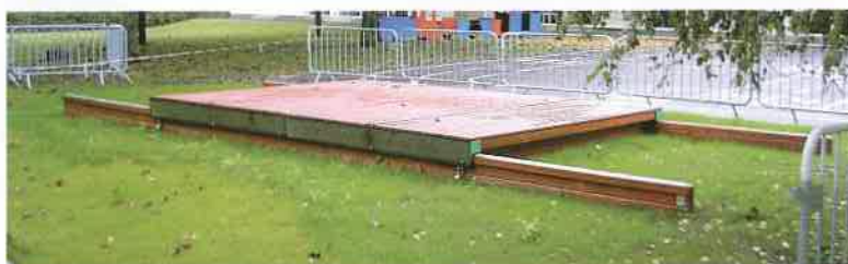
Bac à sable avec couvercles coulissants dimensions intérieures 4 x 3 mètres