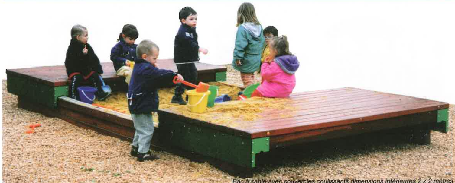
Bac à sable avec couvercles coulissants dimensions intérieures 2 x 2 mètres