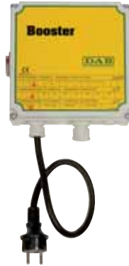
Coffret de démarrage BOOSTER à double condensateur.