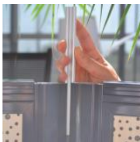
Profil de liaison permettant de relier ou moduler facilement deux cloisons. Possibilité de réaliser des angles jusqu'à 90°.