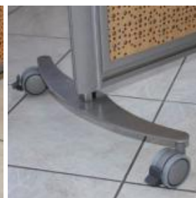
Pied stabilisateur à roulettes autobloquantes de 450 mm de largeur.