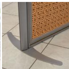
Pied stabilisateur extra plat de 450 mm de largeur.