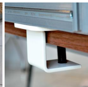
Jeu de pinces universelles AS40 réglables latéralement à positionner en bout de bureau ou entre deux bureaux. Prévoir un jeu par écran de séparation.