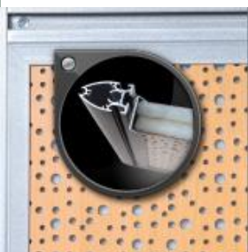
La mousse acoustique et les panneaux microperforés absorbent les bruits générateurs de problèmes de concentration et d'inconfort.

Avec Panacoustik, vous faites un choix écologique et made in France.