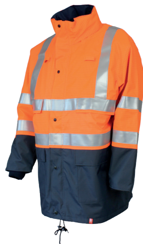
Orange Fluo / Marine 100