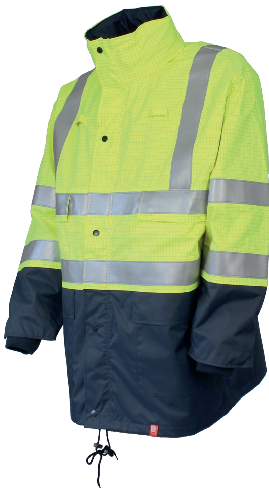
Jaune Fluo / Marine 96