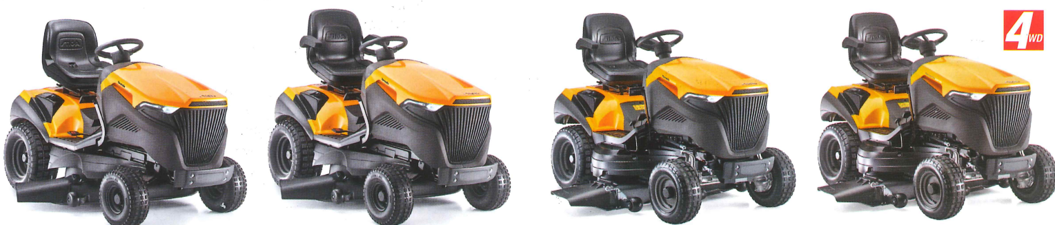
Tornado 6108 HW