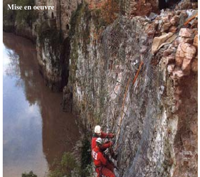
Mise en oeuvre

Le placage du grillage le long de la paroi peut être effectué à l'aide d'ancrages. La protection peut être laissée libre à la base, avec un lestage, ou ancrée à 0.50 m du sol. Dans ce cas, retourner le grillage sur 0.30 à 0.50 m et assurer l'ancrage de façon à pouvoir effectuer périodiquement des purges.