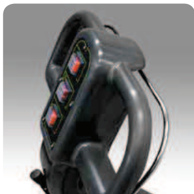
Tableau de commande analogique, simple et intuitif. Levier de commande par actionnement de la brosse et refoulement de la solution détergente. Interrupteur général allumage/arrêt, interrupteur allumage/arrêt du moteur de la brosse et d'aspiration, interrupteur d'activation de l'électrovanne.

Suceur parabolique, remplacement facile des lames en caoutchouc. Le plateau oscillant des brosses garantit une pression de nettoyage correcte sur tous les types de sols.