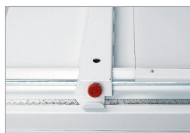
Butée latérale graduée et butée arrière verrouillable