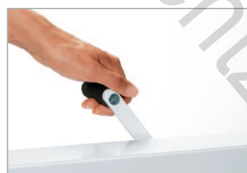
Dispositif de pression rapide par levier

Massicot manuel de table d'entrée de gamme, totalement sécurisé et avec une longueur de coupe de 430 mm.