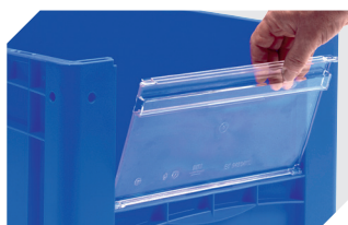
Visière pour bacs gerbables norme Europe, série XL 1 460 x H 148 mm 43-20271