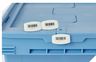
Plombage à codes à barres MBP3 - pour la BITOBOX MB toutes dimensions et pour bacs XL 800 x 600 mm 6-31550