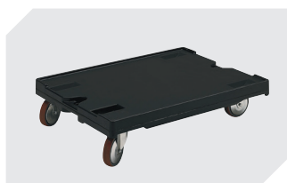
Plateaux roulants pour bacs 800 x 600 mm 1 800 x 1 600 mm 43-1150