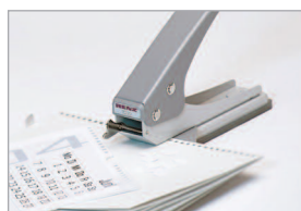
Découpe nette sur des liasses jusqu'à 20 feuilles

Conforme aux normes de sécurité européennes.