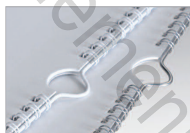
Indispensable pour la réalisation de calendriers