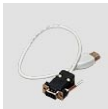
DB9M - USB