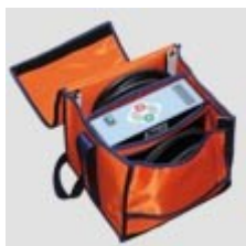
Machine à Électrofusion et sac