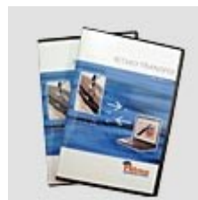
Logiciel clé USB