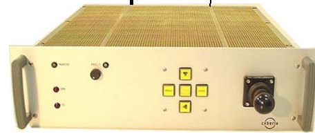
REGIE DE CONTROLE