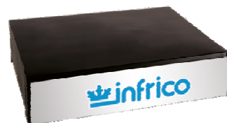
Tête décorative éclairée