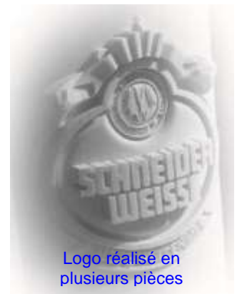
Logo réalisé en plusieurs pièces