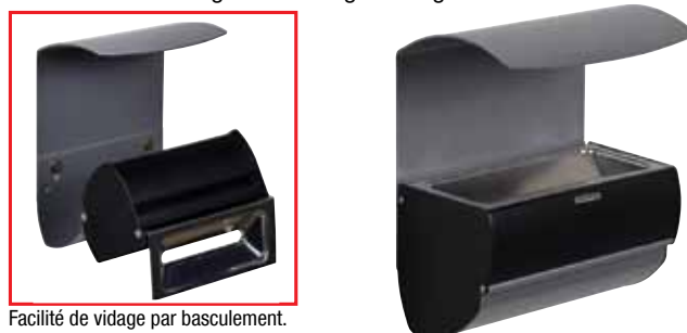
Facilité de vidage par basculement.