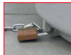
Œillet moulé dans la masse pour accrochage à un poteau