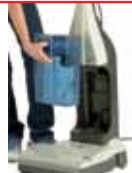
Réservoirs eau propre/sale indépendants, intégrés dans un même bac.