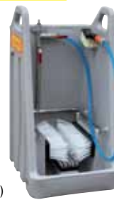
Ecoulement des eaux usées (livré obturé)