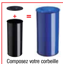
Composez votre corbeille