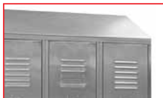
Option : coiffe inox sur demande