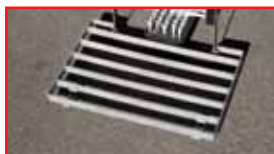
Caillebotis en acier inox.