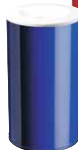
DDIJ1141 + DDIJ1151