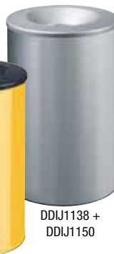
DDIJ1138 + DDIJ1150