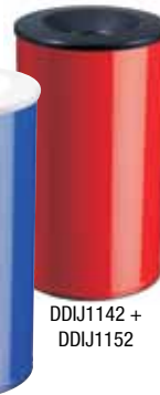
DDIJ1142 + DDIJ1152