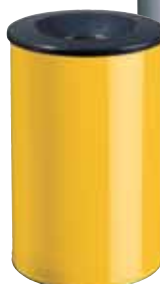
DDIJ1137 + DDIJ1152