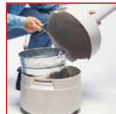
Seau dans le réceptacle