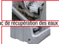
Bac de récupération des eaux usées