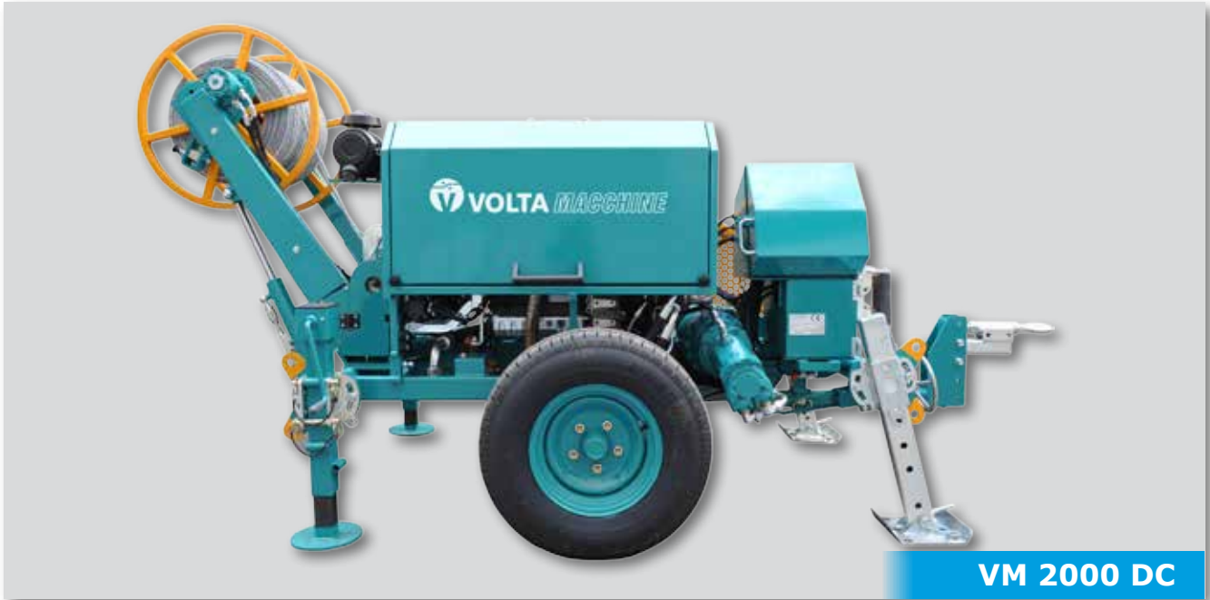
VM 2000 DC