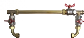
BY-PASS LAITON pour DUPLEX SOE10021