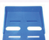
EQUERRE DE FIXATION simple + 2 vis SOE10005