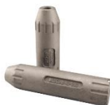
Messageurs monoblocs 225-300g