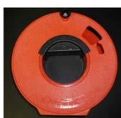
Tambour pour lignes (capacité 60 mètres)