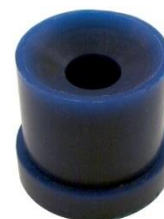
Absorbeur de choc, s'intercale entre le messageur et la tête de déclenchement. Conseillé pour les grandes profondeurs