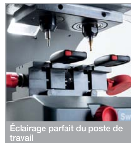
Éclairage parfait du poste de travail