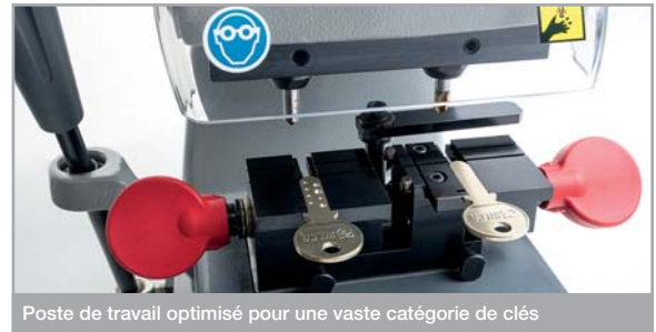
Poste de travail optimisé pour une vaste catégorie de clés

Les leviers et les poignées sur Swift Plus sont en technopolymère et leur forme ergonomique garantit une prise et un maniement aisé. Le mouvement du chariot