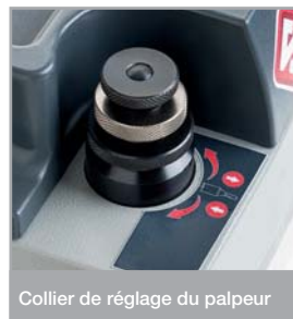
Collier de réglage du palpeur

L'interrupteur général de la machine est magnétothermique ; c'est un dispositif de sécurité qui empêche le redémarrage de la fraise quand le courant revient après une panne.