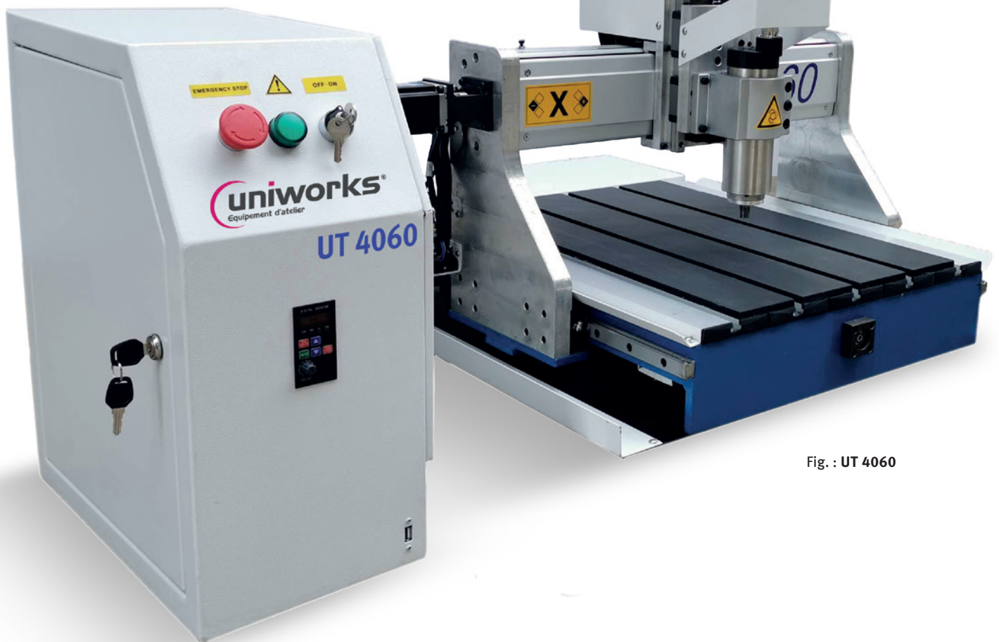
Fig. : UT 4060