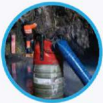
POMPE DE RELEVAGE