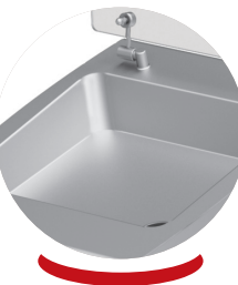
Réserve importante Large meat storage