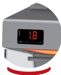
Propreté et finition parfaites dans les moindres détails Perfect cleanliness and completion