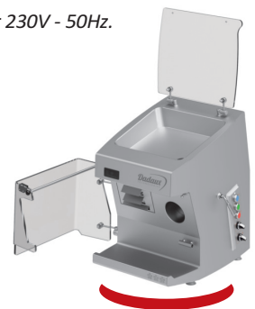
Machine en position nettoyage Machine in cleaning position

Dimension: Larg. 416 x Long. 556 x Haut. 574 mm (Sur pieds: 381x381 mm).