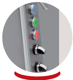
Tableau de commande parfaitement étanche Waterproof control panel