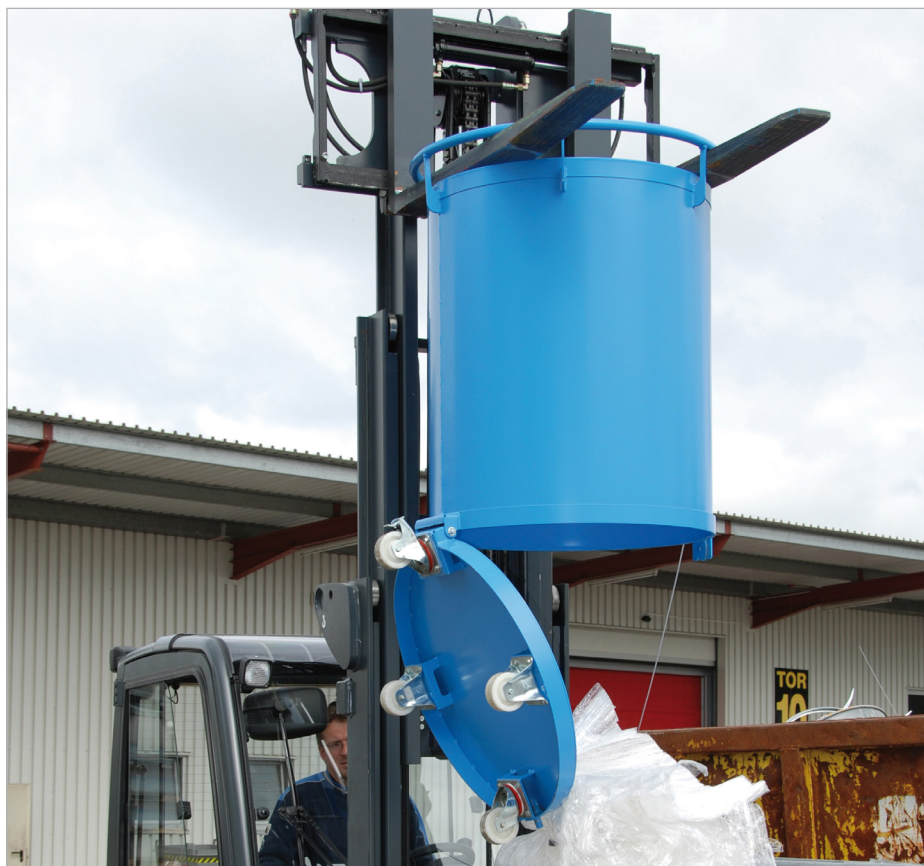
RB à roulettes