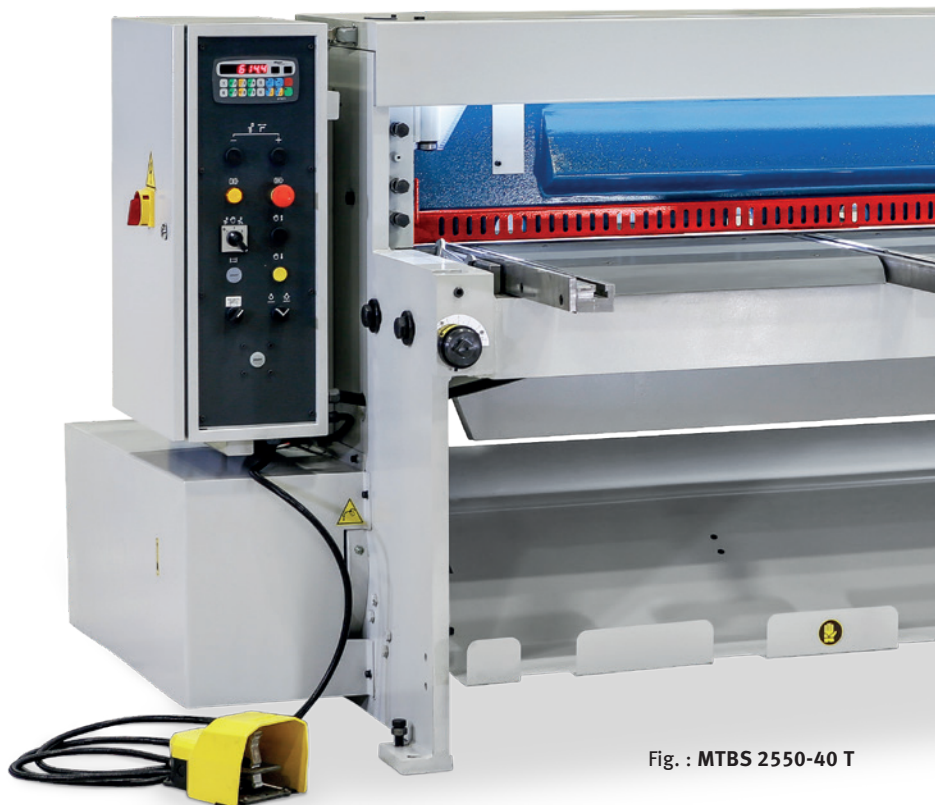
Fig. : MTBS 2550-40 T