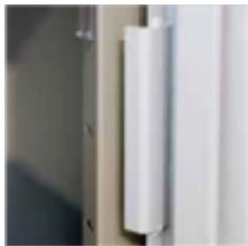
Renfort de poignées