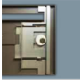
Système translatif toute hauteur