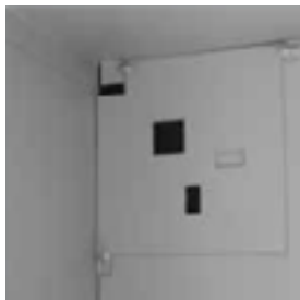
Renfort de coffre