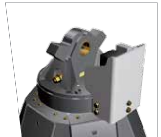
Girevole con ralla Hydraulic rotators