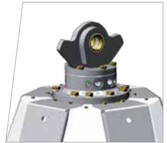
Rotatore Indexator incassato Hydraulic rotators indexator