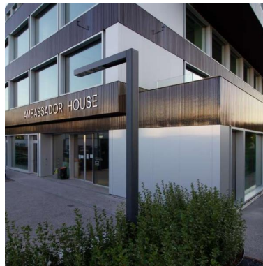
Ambassador House Zürich CH - Zürich