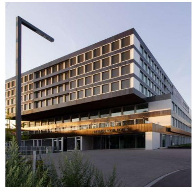
Ambassador House Zürich CH - Zürich