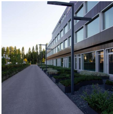
Ambassador House Zürich CH - Zürich