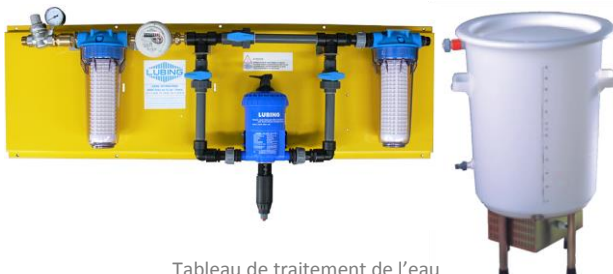
Tableau de traitement de l'eau