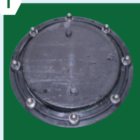
Trappe de visite