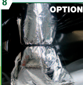
OPTION Protection thermique