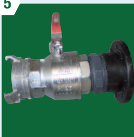
Vidange DN 80