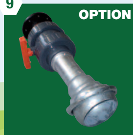
OPTION Embout tonne vanne