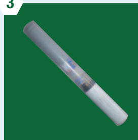
Kit de réparation