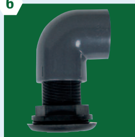
Events de dégazage