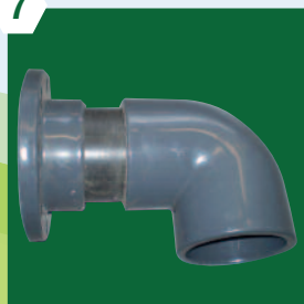
Coude prise dessous