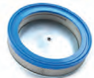
Filtration HEPA H14 disponible

Construction industrielle en acier peint epoxy