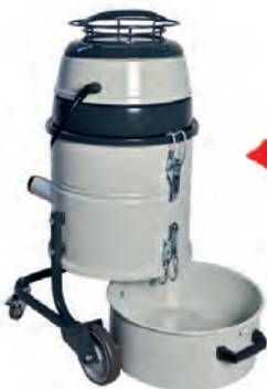
Cuve facilement décrochable

Roues de qualité industrielles dont 2 roues multidirectionnelles