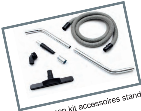
Livré avec son kit accessoires standard