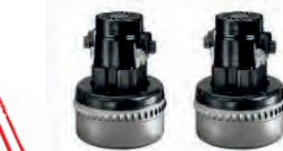
Deux moteurs by-pass monophasés

Le câble se range facilement sur la tête de l'aspirateur