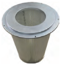
Filtration conique catégorie M PTFE 1 \mu Surface filtrante 30 000 cm 2

Construction industrielle en acier peint epoxy