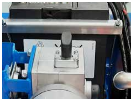
Levier neutre pour déverrouiller le moulinet Neutralhebel zum Entriegeln der Rolle