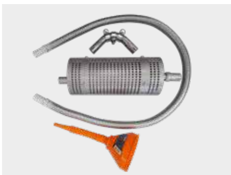
Kit silencieux standard sur tous les modèles Standard-Schalldämpfer-Kit bei allen Modellen