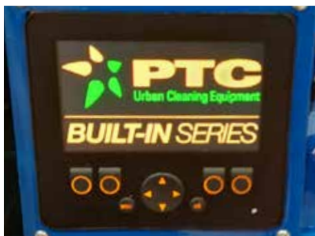
Écran à couleur pour la gestion de la machine PLC-Farbbildschirm zur Verwaltung der Maschine