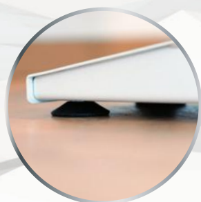
Vérins de mise à niveau.