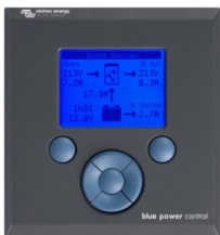
Tableau de commande Blue Power

Une solution pratique et bon marché pour une surveillance à distance, avec un bouton rotatif pour configurer les niveaux de Power Control et Power Assist.