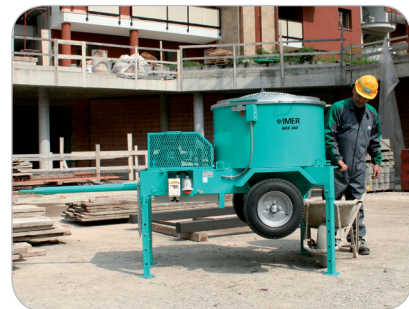
** Sous réserve d'utiliser les matériaux dans des conditions optimales.