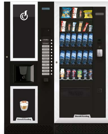
LEI400 + ARIA M MASTER