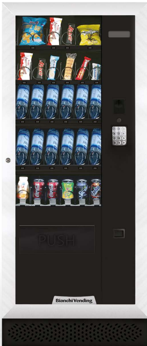
ARIA M MASTER

ARIA M, distributeur automatique réfrigéré à 3° pour la vente de produits snacks, sandwiches, produits frais, boîtes et bouteilles. Disponible en version master ou slave.