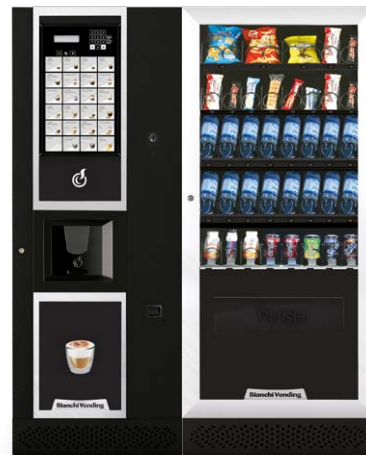
LEI400 SMART + ARIA M SLAVE