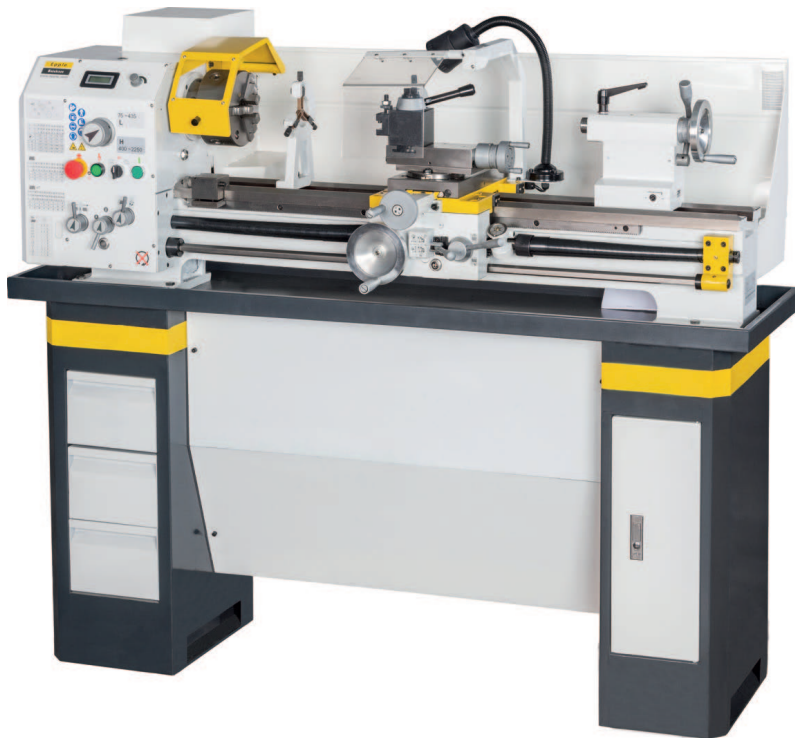
FIG.: TD 3209 VARIO AVEC LE SOCLE EN OPTION