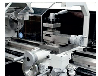
Capot de sécurité de la tourelle