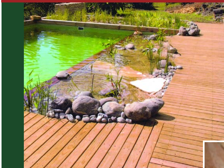
Réalisation : Espaces Verts Jaroussie (Biotech)

Ci-contre : la tendance aux piscines naturelles et écologiques fait une large place aux terrasses bois.