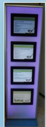
Modèle 4 écrans