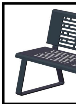
Autre découpe laser