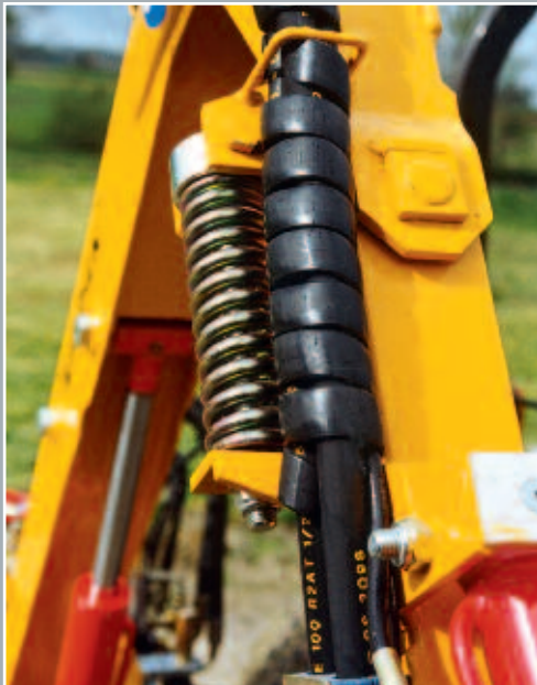
SÉCURITÉ DU BRAS AVEC RESSORT