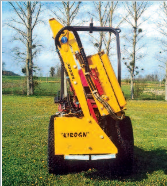
POSITION REPLIAGE COMPLET