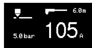
Interface intuitive multilingue