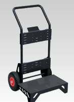
Chariot diable 039568

Coffret consommables 45 - 65 - 85 A 85 - 105 A 039537 064720